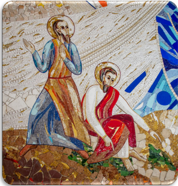
Mosaico di M.I. Rupnik "Gli apostoli Pietro e Giovanni" Chiesa SS. Giacomo e Giovanni, Milano