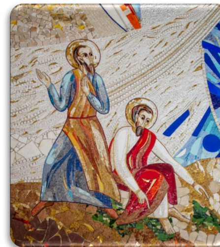
Mosaico di M.I. Rupnik "Gli apostoli Pietro e Giovanni" Chiesa SS. Giacomo e Giovanni, Milano

SPAZIO DI INCONTRO NELLA FEDE, RIVOLTO A PERSONE SEPARATE, DIVORZiate O CHE VIVONO NUOVE UNIONI